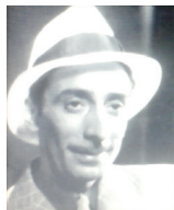
'Slika 1: Enrique Santos Discepolo - eden od glavnih tvorcev tanga.

In tistemu, ki se požvižga - na - zakon!"