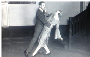
'Slika 2: Ples tango v Londonu, že leta 1934 se je razširil po svetu. Tango je izraz strastne želje po živi, etični lepoti.